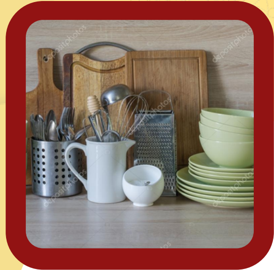
KITCHEN UTENSILS AND CROCKERY