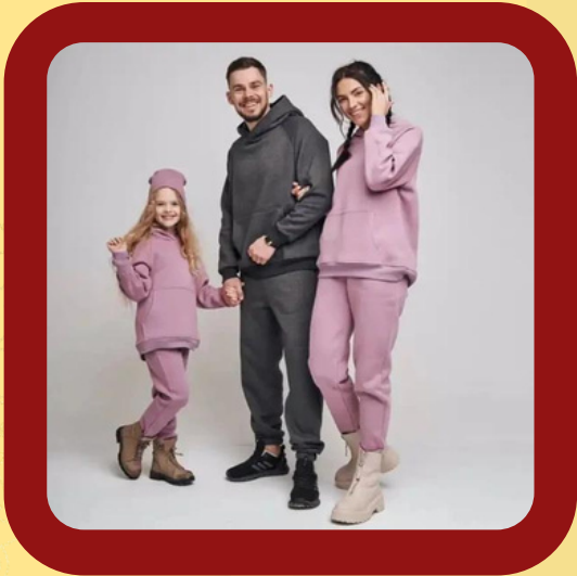
CLOTHING AND APPAREL