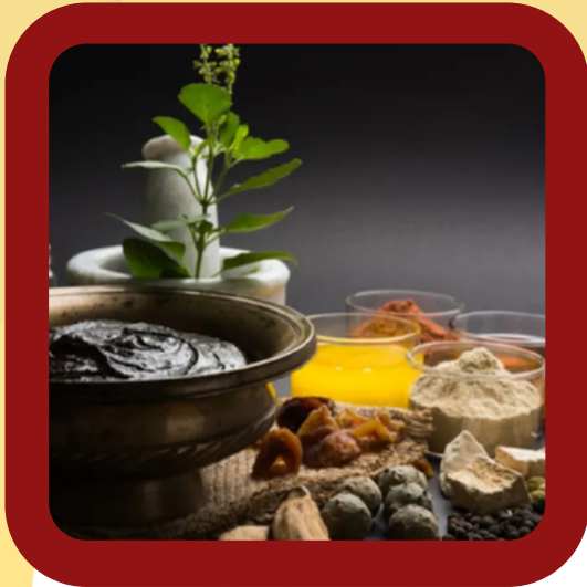
AYURVEDIC AND WELLNESS PRODUCTS