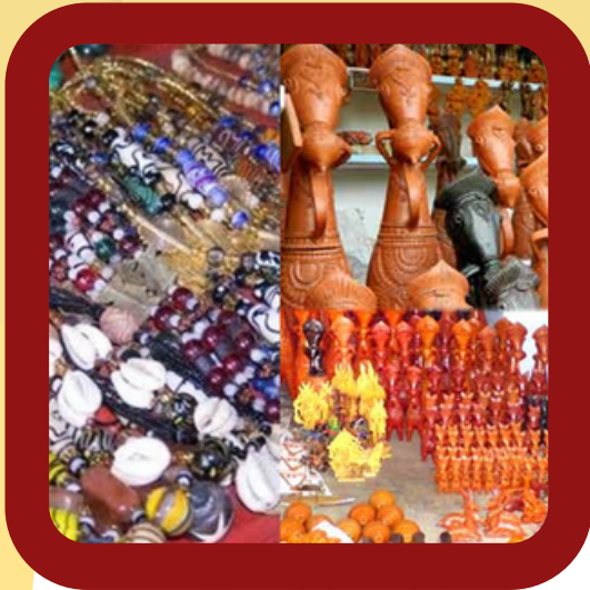
HANDMADE CRAFTS AND ART