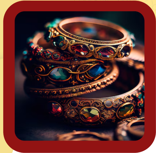
ACCESSORIES AND JEWELRY