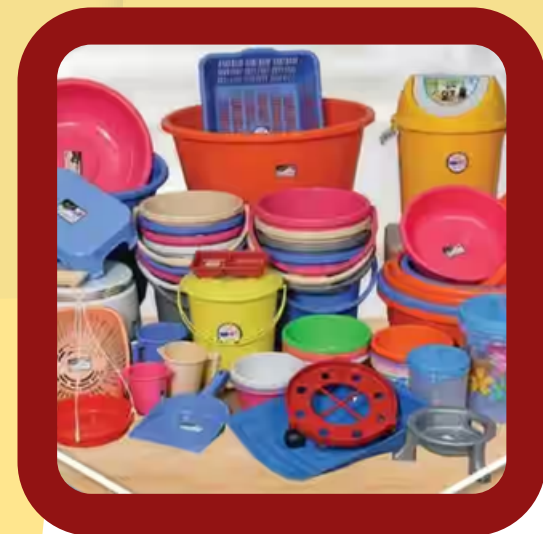
ALL TYPES OF PLASTIC PRODUCTS