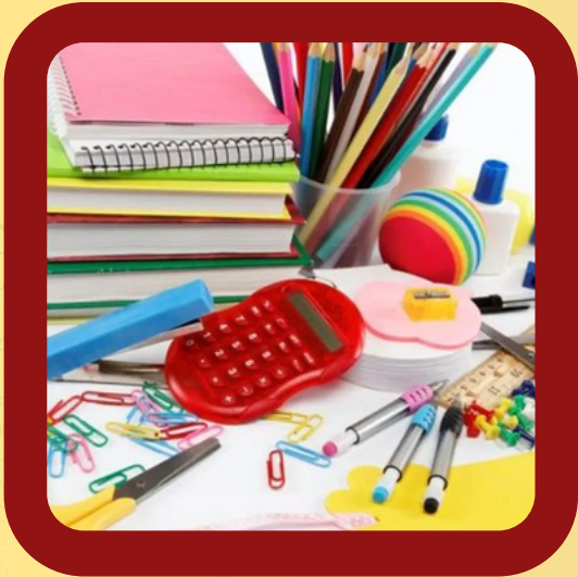
STATIONERY ITEMS AND EDUCATION ITEMS