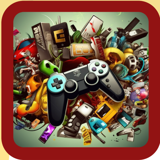
TOYS AND GAMES