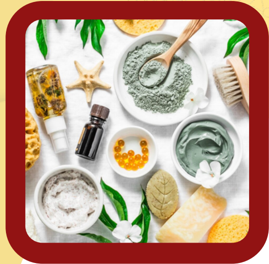
HEALTH AND BEAUTY