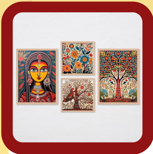
PAINTING ARTWORKS / POSTER