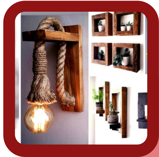
HOME DECOR AND WALL ART