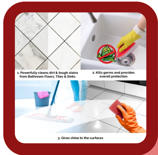
BATHROOM AND FLOOR CLEANER