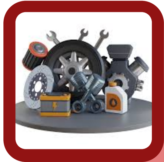
AUTOMOTIVE ACCESSORIES AND EQUIPMENT