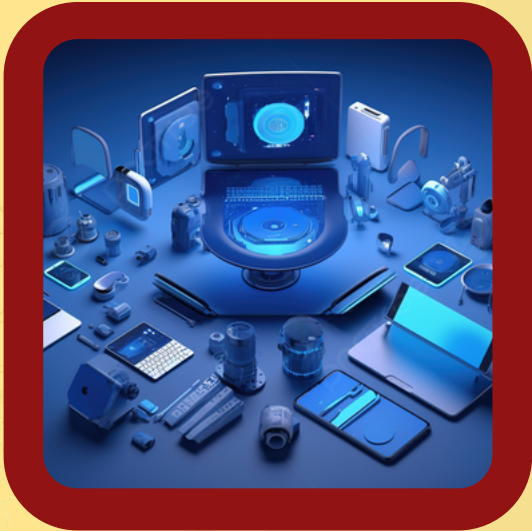
ELECTRONIC AND GADGETS