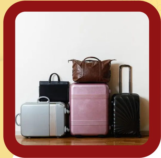
ALL TYPES OF BAGS AND LUGGAGE